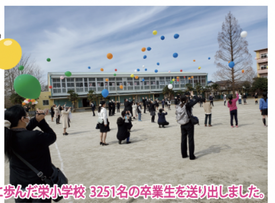
約50年間、北本市制と一緒に歩んだ栄小学校 3251名の卒業生を送り出しました。